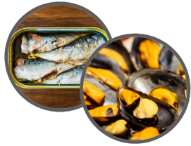
PESCADO PROCESADO Y MARISCO

! Se genera sobre todo durante el tratamiento térmico, por lo que se asocia al consumo de alimentos procesados y/o cocinados.