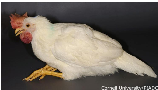
Ahulezia eta depresioa, MAPA MAPA