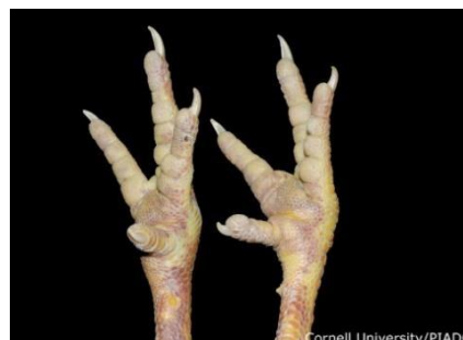
Ekimosia hanketan , MAPA