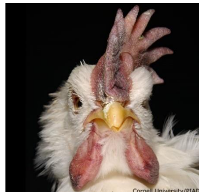
Zianosia gandorrear eta gingilean ,