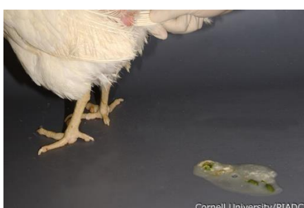
Gorozki urtsuak, MAPA