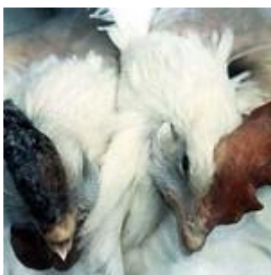
Zianosia gandorrear eta gingilean DEFRA